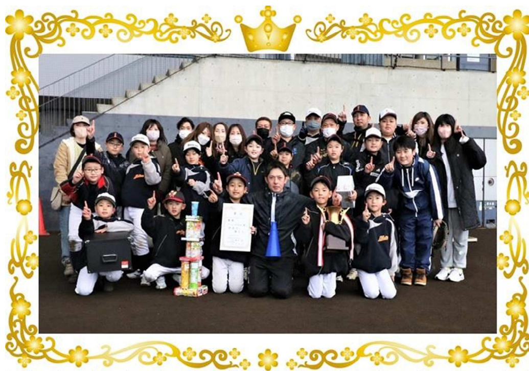
前回大会優勝 チーム つがるB